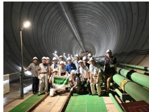
地下貯蔵トンネル内

参加者は西武新宿線「野方駅」に集合し、5分ほど歩き妙正寺川取水口となる工事現場に到着。説明を受けた後、全員ヘルメットをかぶって地下に向かいました。地上にはトンネル先端で掘削機「シールドマシン」から削り取られた土砂を泥水にして地上に引出し、これを土砂と水に分離し再利用するプラントが設置されていました。現在は、シールドマシンのカッタービットを交換しているとのことで、工事は一時休止状態でした。50m地下に工事用のエレベータで降りて地下貯留トンネルを約500m先まで見学しました。実際の掘削地点はずっと先になります工場の状況が良く理解できました。これが完成すると時間100mm程度の降雨までに対応できるようになるとのことです。最先端の土木技術を目のあたりにしながらか驚きの連続でした。(記 柿本政昭)