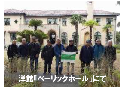
洋館「ペーリックホール」にて

まずは、みなとみらい線「元町・中華街駅」に集合し、横浜港を望む景色を楽しみながら散策をスタート、「港の見える丘公園」、「外交官の家」などの山手洋館を巡り、異国情緒あふれる街並みをゆったりと歩きました。又、元町商店街へ下る道中では、近況を語り合う姿も見られ、終始和やかな雰囲気でした。