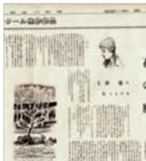
神奈川新聞掲載「石の庭」