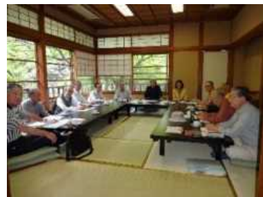
小石川後樂園吟行風景

東京支部に「川柳同好会」が発足したのは2008年6月16日、今年で18年の歴史を刻みました。最盛時は14名で、時には記念大会を開き、吟行では温泉に浸かって句を作り、清澄庭園・小石川後樂園(写真)や築地界限などで句をひねりました。現在は会員5名のうち2名が病に侵され、残念ながら実活動は3名(+講師)です。社友会東京支部の会員は510名(1/末現在)います。文芸の同好会は「とうりゅう会」だけです。会社が理工系といっても文芸の愛好家はたくさんいると思います。川柳仲間に白寿の人がいます。句会で必ず抜けません。それも斬新な川柳で、川柳は海馬を腐らせません。だから呆けません。老後を健やかに過ごせるための川柳を始めて見ませんか。ご参加を心よりお待ちしております。