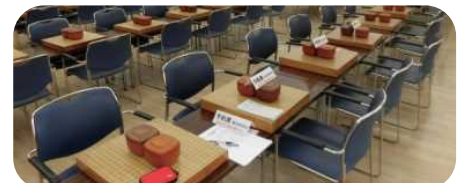
120名の対局場(上)と囲碁同好会の予約席(下)